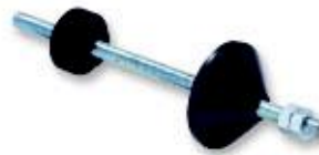
Konuschse für Spulen DR3 001 Spindle for reel mounting DR3 001