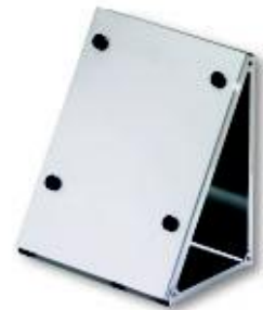
Drehteller Magazin DR3 050 Rotary Plate Holder DR3 050 BxHxT 410x482x299